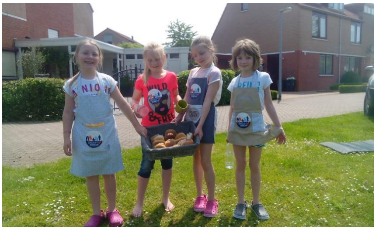
Een hengeldag zonder catering is natuurlijk geen échte hengeldag. Gelukkig stonden de dames van "De Gulden Kwebbel" klaar met koffie, thee en broodjes. Wat wil je nog meer?