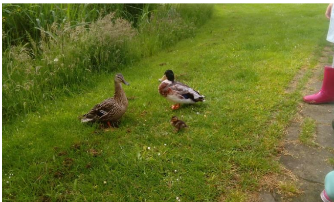
Publiek was er al tijdens het opbouwen. Saillant detail: op de woensdagavond voor de hengeldag had dit kuikentje nog een broertje en een zusje. Dat was vóórdat de snoek begon te jagen.