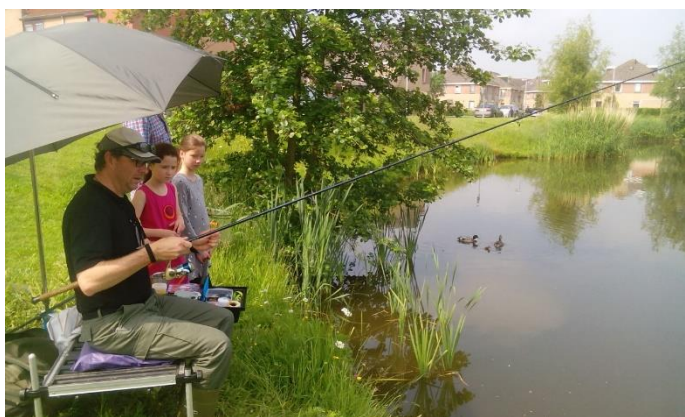
Onze feeder-visser geeft uitleg aan twee jeugdige kijkers die vervolgens een vast hengeltje ter hand namen en achter elkaar door blankvoorn op de kant wisten te brengen. Natuurtalenten!