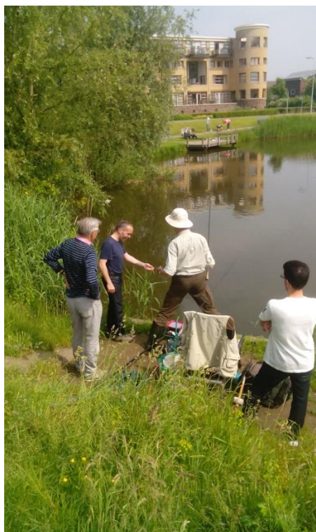
Dat onze vereniging ook een belangrijke sociale taak vervult, bleek bij de match-visser. Hier geeft hij namelijk uitleg aan twee Syrische vluchtelingen