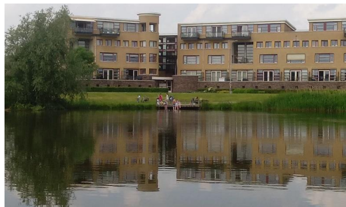
De woningen aan de Grote Loef. Natuurlijk wilden we ook aan de omwonenden laten zien wat onze HSV allemaal doet.