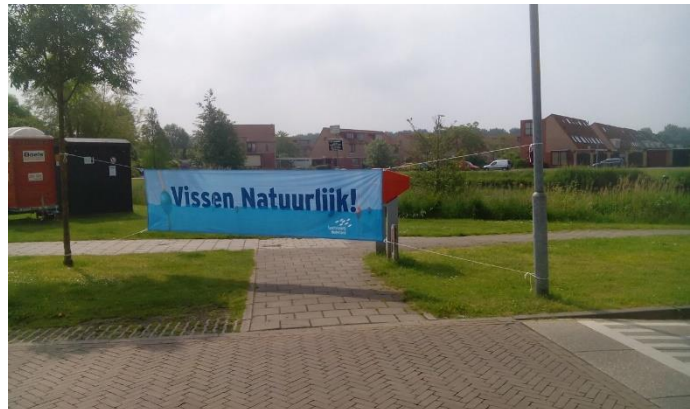
Aan promotie geen gebrek. Het was niet mogelijk om op de Grote Loef te rijden zonder met je neus op de feiten gedrukt te worden.

Aan de Grote Loef in Malden verzorgden vrijwilligers demonstraties in verschillende vistechnieken, waren er speciale dagvergunningen voor mensen zonder Vispas en kon de jeugd met of zonder begeleiding gratis mee vissen. Beelden zeggen meer dan woorden, dus daarom hebben we een korte foto-compilatie van deze gezellige en succesvolle dag gemaakt.