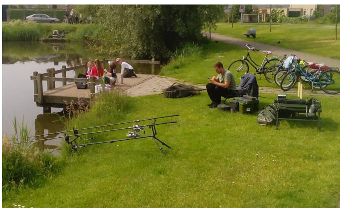
Onze karpervisser liet zien dat je met moderne technieken lekker kunt chillen aan de waterkant. Het publiek op de steiger was erg geïnteresseerd in de vissen in het water die vanaf daar goed te zien waren.