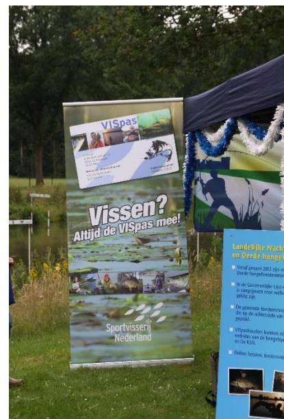
Ook karpervissen doe je met de ViSPas. Dat was een belangrijke boodschap van de federatie.