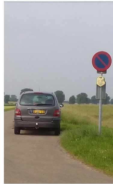
Parkeerverbod op de Maasbanddijk. Dit is misschien wel de domste plek om je auto te parkeren!

Ingewikkeld? Muggenzifterij? Ja, dat is het! Gelukkig hoeft jij je er als visser niet druk om te maken! Jij mag hier namelijk NOOIT parkeren. Want, één van de voorwaarden op onze vergunning is dat je je auto uitsluitend mag parkeren op de twee aangewezen parkeerplaatsen: onder aan de dijk ter hoogte van de 2 e kolk en op de dijk tussen de 2 e en 3 e kolk in. Deze voorwaarde is opgesteld om overlast voor brede landbouwvoertuigen te voorkomen en om er dus voor te zorgen dat wij ook in de toekomst in de Erpewaai kunnen blijven vissen. Je auto even stoppen om spullen uit te laden en hem daarna ergens anders te parkeren, mag natuurlijk wel!