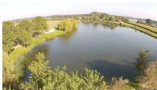
Visvijver De Sprong vanuit de lucht. De locatie voor ons vrijwilligersuitje in 2016.

Het draaiend houden van een vereniging als de onze brengt behoorlijk wat werk met zich mee. Denk maar eens aan het onderhoud van en rondom de vijvers en de kolken, het organiseren van wedstrijden en evenementen, de contacten met gemeente, waterschap en landeigenaren of het overleg met andere beheerspartijen zoals de lokale wildbeheerseenheid of de Vereniging Nederlands Cultuurlandschap. Niet voor niets dus dat het bestuur de bijdrage van onze vrijwilligers enorm waardeert. Vandaar ook dat we ieder jaar een vrijwilligersuitje organiseren. Dit jaar gaan we met de vrijwilligers een dagje vissen op De Sprong in Rijkevoort. Wil jij ook (af en toe) je steentje bijdragen? Neem dan gerust contact op met iemand van het bestuur. Het zijn stuk voor stuk vriendelijke kerels die je geregeld aan de waterkant vindt. En anders is er altijd nog onze secretaris: secretaris@hsvdevriendenkring-heumenmalden.nl of 06-13126722. Een keer een dagje helpen is vaak al meer dan genoeg!