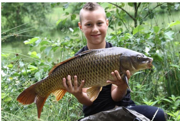
Kleine mannen, grote vissen...