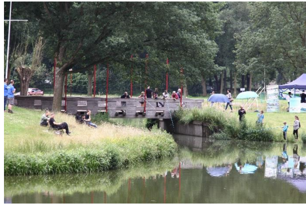
Voor de middag was het goed toeven. Geen visstek meer vrij!

Het Spiegelkarperproject Nijmegen (SKP Nijmegen) behartigt de belangen met betrekking tot het uitzetten van karper in de regio Nijmegen. HSV De Vriendenkring ondersteunt dit project van harte en is er daarom sponsor van. Op zaterdag 25 juni organiseerde SKP Nijmegen, in samenwerking met Hengelsportfederatie Midden Nederland, een Karper Jeugddag op de vijvers van St. Jan aan de Winkelsteegseweg in Nijmegen. Het was een leuke dag waar bekende karpervissers niet alleen hun geheimen prijs gaven, maar waar de jeugdige toeschouwers zelf de hengels ter hand mochten nemen. En dat deden ze met succes. Voor de middag was het weer goed; na de middag regende het behoorlijk. Toch liet de échte jeugdvisser zich daar niet door weerhouden.