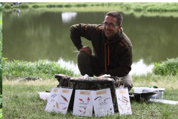
Bekende karpervissers deelden hun geheimen.