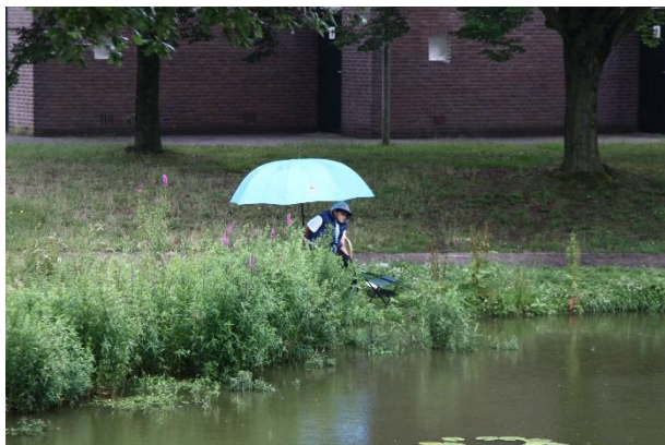
Na de middag liet het weer het af weten. Dat hield de échte vissers gelukkig niet tegen.